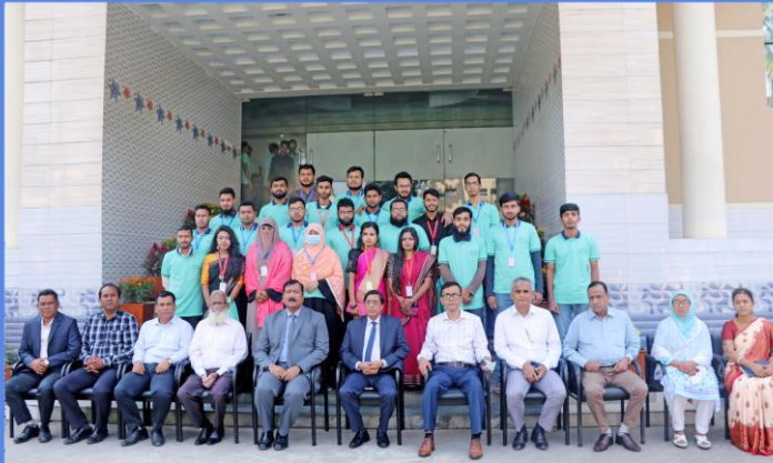
“Graphics Design and Multimedia” Training Course. Duration: 20 September- 18 November, 2022. Sheikh Hasina National Institute of Youth Development, Ministry of Youth & Sports, Savar, Dhaka-1341.