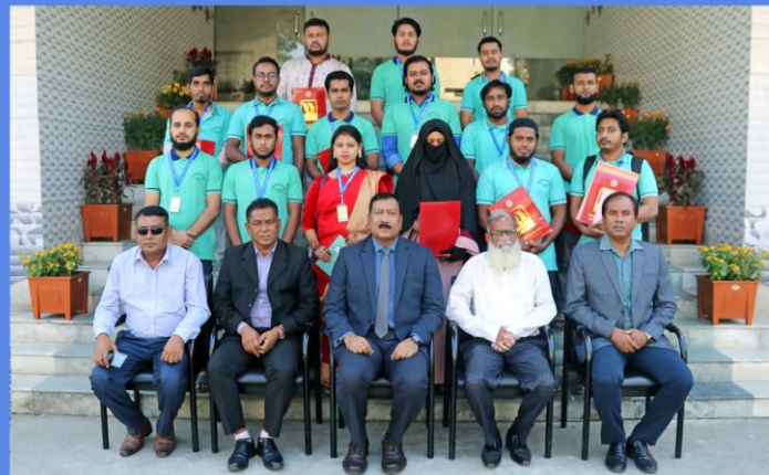
“Web Site Design and Web Application Development and Outsourcing Technique” Training Course. Duration: 28 September - 26 November, 2022. Sheikh Hasina National Institute of Youth Development, Ministry of Youth & Sports, Savar, Dhaka-1341.