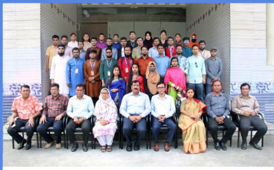
"Digital Marketing" Training Course. Duration: 07 February - 07 April, 2023. Sheikh Hasina National Institute of Youth Development, Ministry of Youth & Sports, Savar, Dhaka-1341.