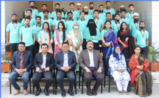
"Multimedia Design" Training Course. Duration: 25 January- 07 February, 2023. Sheikh Hasina National Institute of Youth Development, Ministry of Youth & Sports, Savar, Dhaka-1341.