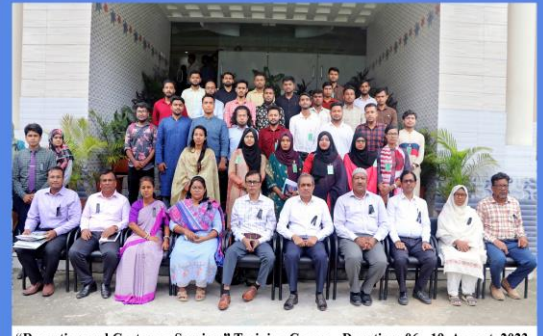
"Reception and Customer Services" Training Course. Duration: 06 - 19 August, 2023. Sheikh Hasina National Institute of Youth Development, Ministry of Youth & Sports, Savar, Dhaka-1341.