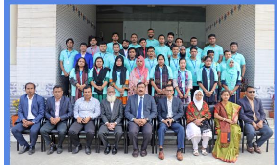
"Food & Beverage Production" Training Course. Duration: 28 September - 26 December, 2022. Sheikh Hasina National Institute of Youth Development, Ministry of Youth & Sports, Savar, Dhaka-1341.