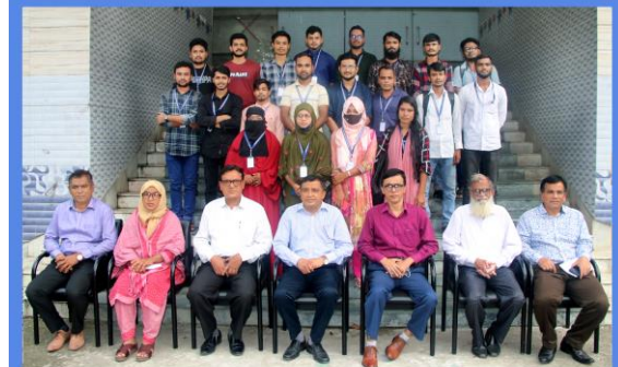
"Data Entry and e-Marketing" Training Course (3 rd Batch). Duration: 13- 26 June, 2022. Sheikh Hasina National Institute of Youth Development, Ministry of Youth & Sports, Savar, Dhaka-1341.