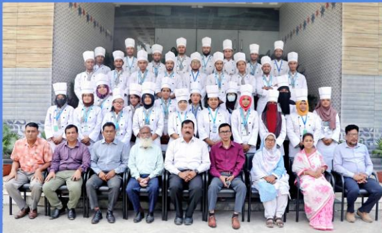
"Bakery and Pastry Production" Training Course. Duration: 18 January - 17 April, 2023. Sheikh Hasina National Institute of Youth Development, Ministry of Youth & Sports, Savar, Dhaka-1341.