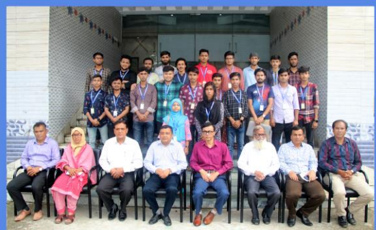
"SEO and Digital Marketing" Training Course. Duration: 1 - 28 June, 2022. Sheikh Hasina National Institute of Youth Development, Ministry of Youth & Sports, Savar, Dhaka-1341.