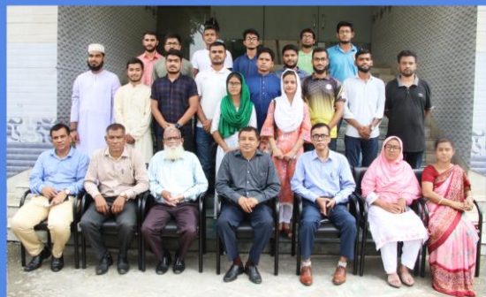
"Youth Leadership and Organizational Management" Training Course. Duration: 05 - 18 September, 2022. Sheikh Hasina National Institute of Youth Development, Ministry of Youth & Sports, Savar, Dhaka-1341.