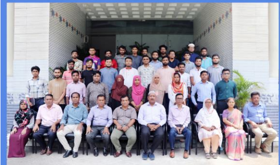
"Web Site Design" Training Course. Duration: 06 August - 02 September, 2023. Sheikh Hasina National Institute of Youth Development, Ministry of Youth & Sports, Savar, Dhaka-1341.