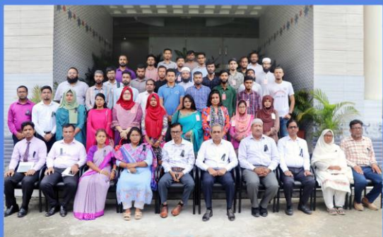
"Small Business and Entrepreneurship Development" Training Course. Duration: 06 - 19 August, 2023. Sheikh Hasina National Institute of Youth Development, Ministry of Youth & Sports, Savar, Dhaka-1341.