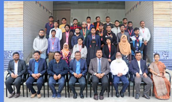
"Adobe Photoshop & Illustrator" Training Course. Duration: 18 - 31 January, 2023. Sheikh Hasina National Institute of Youth Development, Ministry of Youth & Sports, Savar, Dhaka-1341.