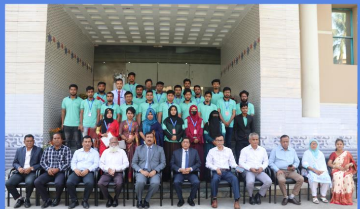
“Digital Marketing” Training Course. Duration: 20 September- 18 November, 2022. Sheikh Hasina National Institute of Youth Development, Ministry of Youth & Sports, Savar, Dhaka-1341.