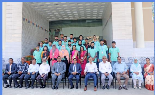
"Graphics Design and Multimedia" Training Course. Duration: 20 September- 18 November, 2022. Sheikh Hasina National Institute of Youth Development, Ministry of Youth & Sports, Savar, Dhaka-1341.