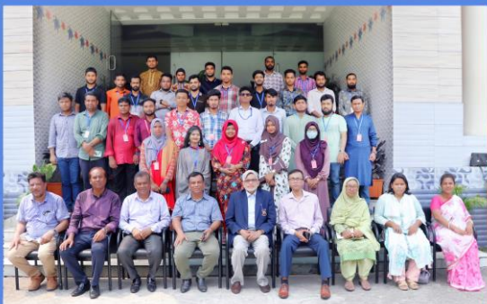
"Communicative Language (English)" Training Course. Duration: 23 May - 19 June, 2023. Sheikh Hasina National Institute of Youth Development, Ministry of Youth & Sports, Savar, Dhaka-1341.