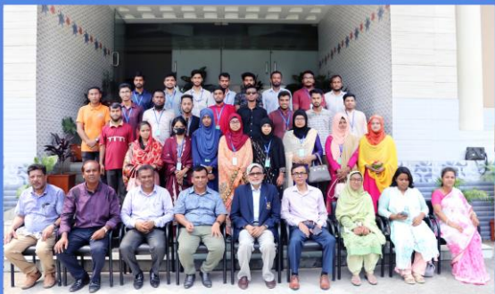
"Tour Guide and Eco Tourism Management" Training Course. Duration: 23 May - 05 June, 2023. Sheikh Hasina National Institute of Youth Development, Ministry of Youth & Sports, Savar, Dhaka-1341.