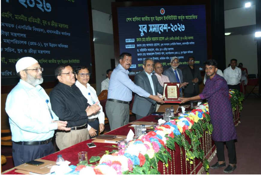
ডিপ্লোমা কোর্সে ১ম স্থান অধিকারীকে মহাপরিচালক কর্তৃক সম্মাননা প্রদান